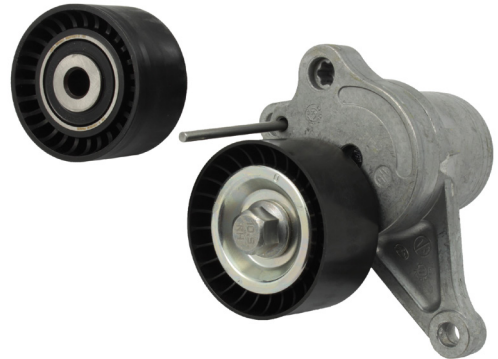
Kuva 2: Muovinen kiristinhinnapyörä ja ohjainpyörä

Nissan ja Renault käyttävät edellä esitettyjen mallien apulaitekäytössä kahta erilaista kiristin- ja ohjainrullatyyppiä. Autoissa voi olla metallinen (kuva 1) tai muovinen (kuva 2) tyyppi.